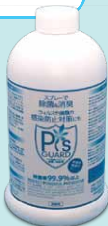
800ml 詰替用 1,995円