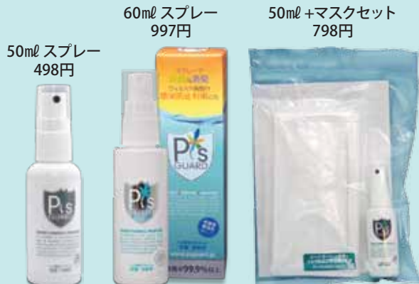
50ml スプレー 498円

芦花ホームでは“看取りの介護”を積極的に行っていて、その際の居室環境整備として「スツ霧くんmini」も使っていますが、その消臭効果にはただ驚くばかりです。ノロにもインフルエンザにも効果があって、しかもたいへん使いやすいので、今では「peesガード」は当ホームの必需品です。