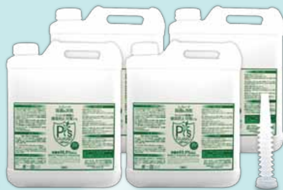
詰替え用 5ℓタンク×4本 (ノズル付) 37,800円