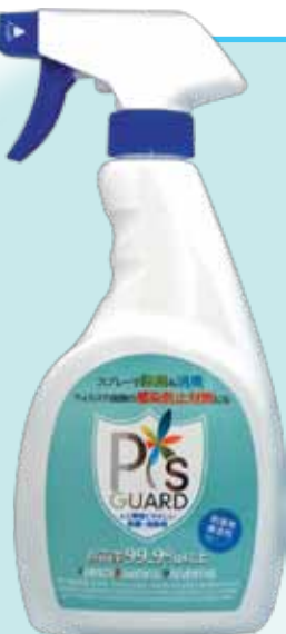
500ml トリガー付 1,785円