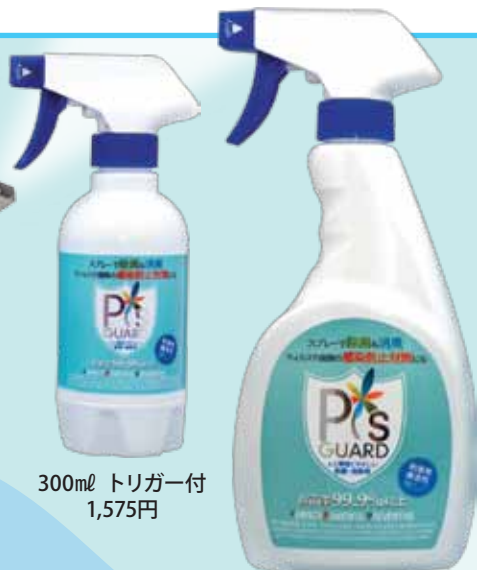
300ml トリガー付 1,575円